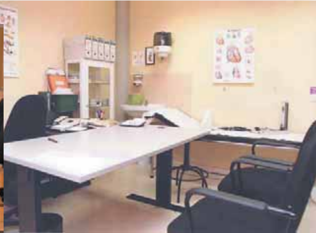
La prestación de determinados servicios médicos, habitualmente excluidos de la Seguridad Social, se promueve desde los Gobiernos Locales para sus empleados.

Al transferir esos Fondos Sociales a un contrato de Seguro se consigue: