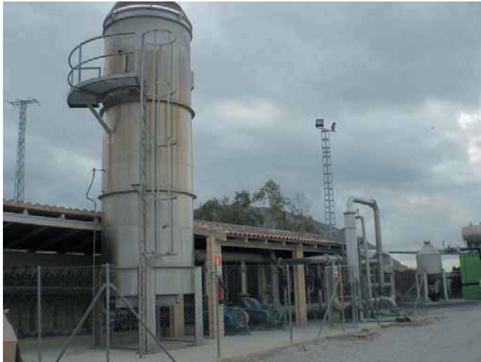
Antorcha de biogas, en Alicante.

En total se entregaron seis galardones correspondientes a otras tantas categorías que vinieron a reconocer el trabajo de Gobiernos Locales en esta materia