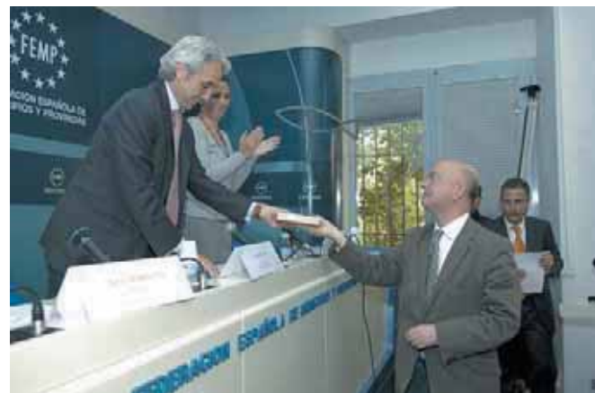
El Alcalde de San Sebastián recibe su galardón.

de una tecnología de alto nivel para la desalación, depuración y potabilización de aguas, y en el que se contempla el máximo ahorro de agua y la aplicación de los avances tecnológicos para reducir el consumo energético en los procesos de desalación, depuración y potabilización. Contempla, asimismo, la minimización