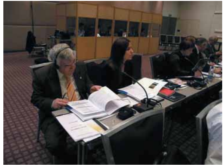
El Presidente de la FEMP durante las sesiones.

Con ellos, el número de miembros del CMRE asciende a 51 –todos ellos asociaciones nacionales de Colectividades Locales– distribuidos por 37 países europeos. Sobre esta base, el CMRE ha acordado que a lo largo de los próximos meses organizará varios