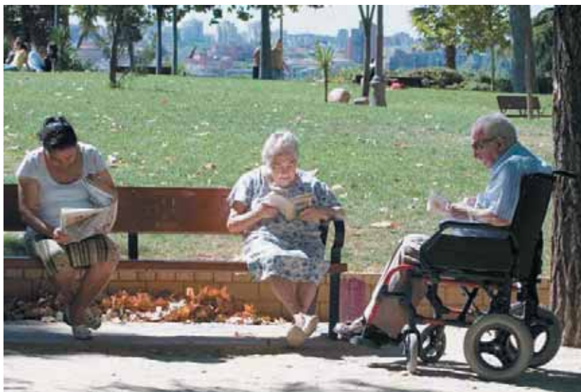
Los Ayuntamientos se han visto obligados a realizar un esfuerzo financiero adicional al asumir la gestión de servicios que no les corresponde, como la atención a los mayores o la integración de inmigrantes.

Otro problema es la falta de adecuación de un modelo financiero general a la diversidad tipológica de los Ayuntamientos. De ahí que se apunte la necesidad de establecer un marco competencial y financiero que garantice la igualdad de los ciudadanos, pero que evite enfoques excesivamente simplistas y uniformes, teniendo en cuenta la diversidad de las carencias económicas y de la problemática de la gestión de los Ayuntamientos.