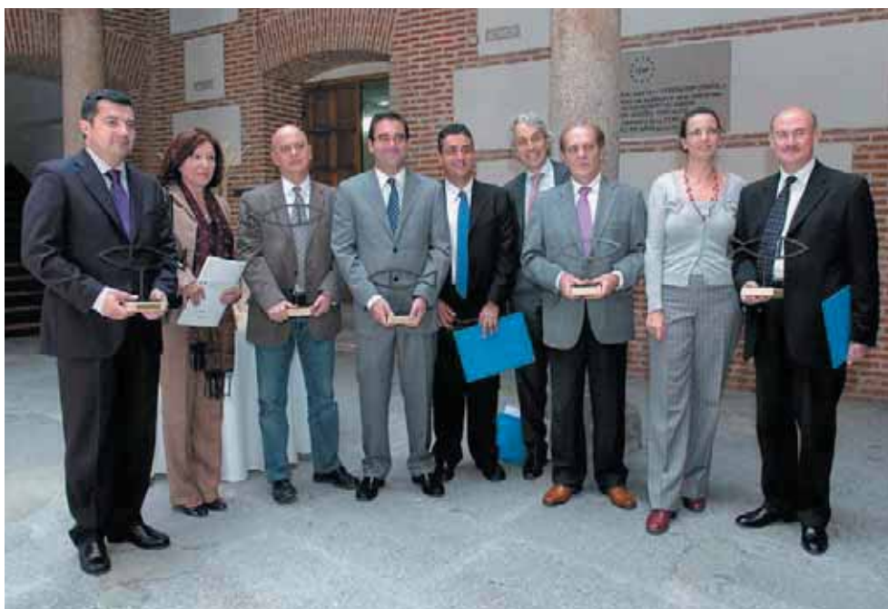
Los premiados, junto a los promotores, tras recibir el premio.

Los Ayuntamientos de Alicante, Collado-Villalba, Donostia-San Sebastián y Sevilla, la Mancomunidad Sureste de Gran Canaria y la Diputación de Jaén recibieron los Premios Ciudad Sostenible, galardones que conceden la Fundación Forum Ambiental y Ecocity y que este año cumplen su sexta edición. El acto se celebró en la sede de la FEMP.