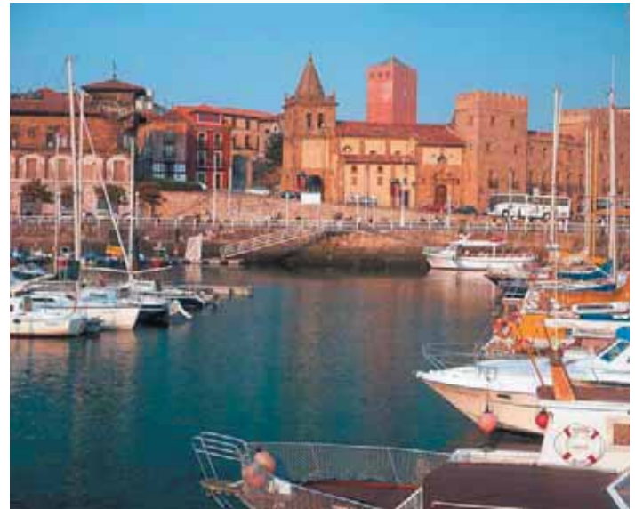
Puerto Deportivo de Gijón.