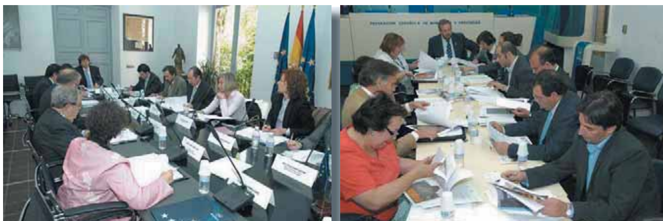
Las Comisiones de Cultura y de Patrimonio Histórico-Cultura, durante las reuniones simultáneas celebradas el pasado mes de mayo.