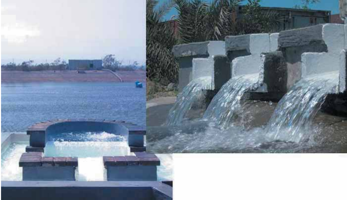
Tratamiento de agua en la Mancomunidad del Sureste de Gran Canaria.

programa de educación ambiental para fomentar la implicación de la ciudadanía y la concienciación sobre la importancia de una conducta ecológica.