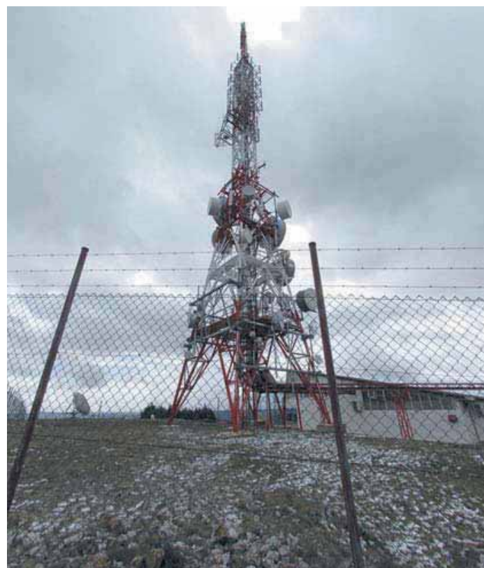
Emisor de TDT en la provincia de Soria.

El pasado 20 de mayo, el Ministro de Industria, Turismo y Comercio, Miguel Sebastián, anunciaba en Soria que el "apagón analógico" iba a hacerse efectivo el 23 de julio en todos los municipios incluidos en el proyecto Soria TDT.