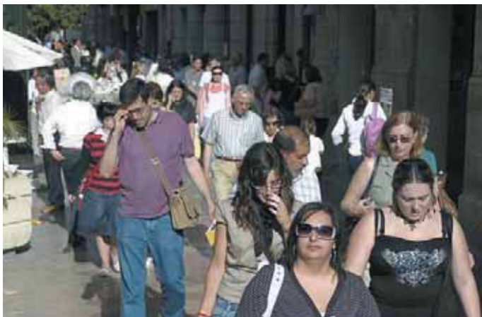
Los Gobiernos Locales son los que mejor y más barato pueden gestionar los servicios públicos que tienen que ver con las personas.

Los Alcaldes presentes en dicha reunión reafirmaron su "apoyo sin fisuras" a los principios de la estabilidad presupuestaria, pero criticaron tanto la forma de aplicarla como el que los escenarios económicos "poco realistas" sobre los que se basa. Ese aspecto de la crítica es crucial por cuanto que la actividad inversora y de prestación de servicios que deberán desarrollar en ese período las Entidades Locales puede verse gravemente afectada si dichos escenarios son más desfavorables que los presentados.