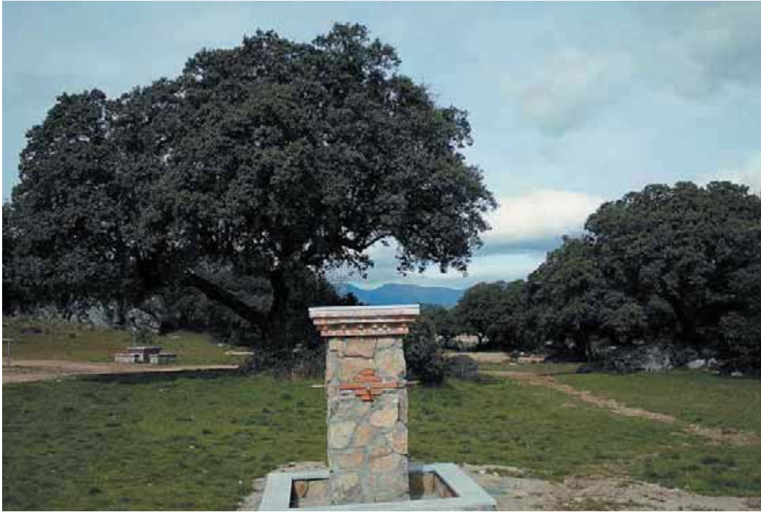
Rincón del Coto de las Suertes, en Collado-Villalba.

La FEMP ha participado en el jurado junto con los Ayuntamientos de Barcelona, Madrid y Vitoria, el Ministerio de Medio Ambiente y la Fundación Forum Ambiental, así como varios organismos autonómicos