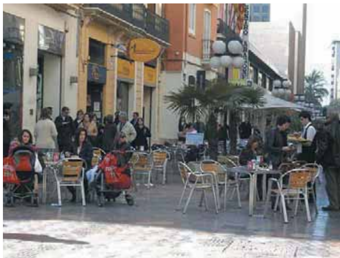
Ágora ha supuesto un escaparate para las experiencias de más de 53 municipios españoles y una oportunidad de intercambio de ideas y propuestas.