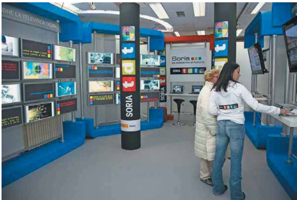
Campaña de presentación.

Xunta se acordó entregar uno por familia; está pendiente completar la entrega en las zonas donde está aun pendiente la señal.