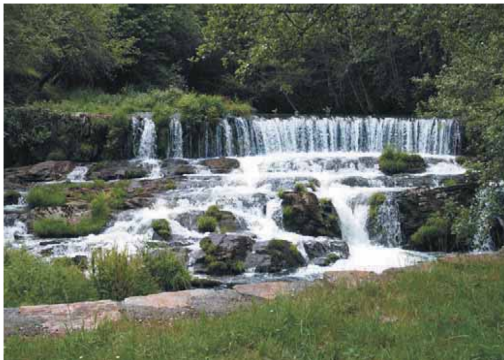
Uno de los rincones naturales de A Fonsagrada, el primer municipio en completar el apagón analógico.

En España, el planteamiento elegido inicialmente para impulsar la TDT fue conceder en 1999 una primera licencia de explotación a una empresa que empezó a emitir en el año 2000 bajo la modalidad de pago y la marca Quiero TV. Posteriormente en noviembre del 2000 el Gobierno adjudicó dos programas en abierto a otros dos canales (Vevo TV y Net TV), que iniciaron sus emisiones en junio del 2002. Adicionalmente se dividió un canal múltiple en cinco programas que se repartieron entre los operadores estatales analógicos existentes, dos para RTVE y uno para cada uno de los emisores privados (Antena 3, Tele 5 y Sogecable).