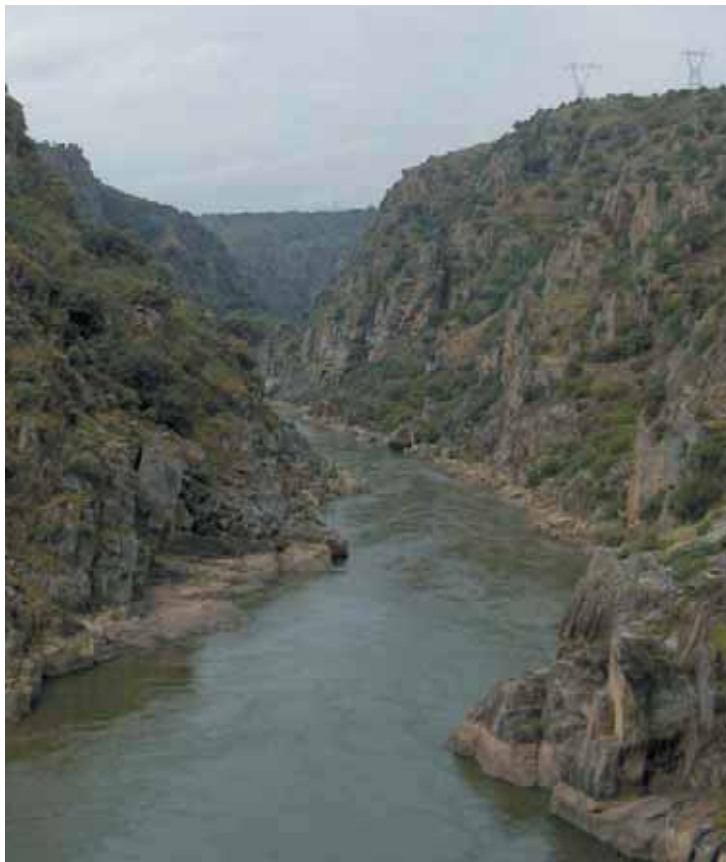
Arribes del Duero en la provincia de Zamora; el río actúa de frontera natural entre España y Portugal.