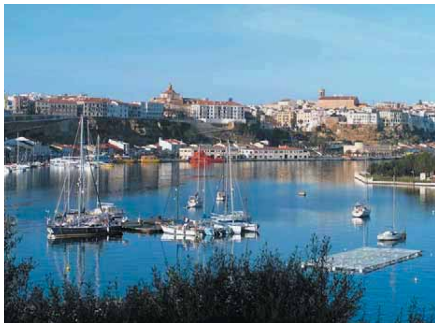
Vista del Puerto de Maó (Menorca).

Cerca de una treintena de municipios de toda España han decidido unir sus esfuerzos para consolidarse como destinos turísticos de calidad. Para ello, han creado en el seno de la FEMP una Sección de Entidades Locales con Sección Náutica, cuya Asamblea constitutiva se celebró en Menorca.