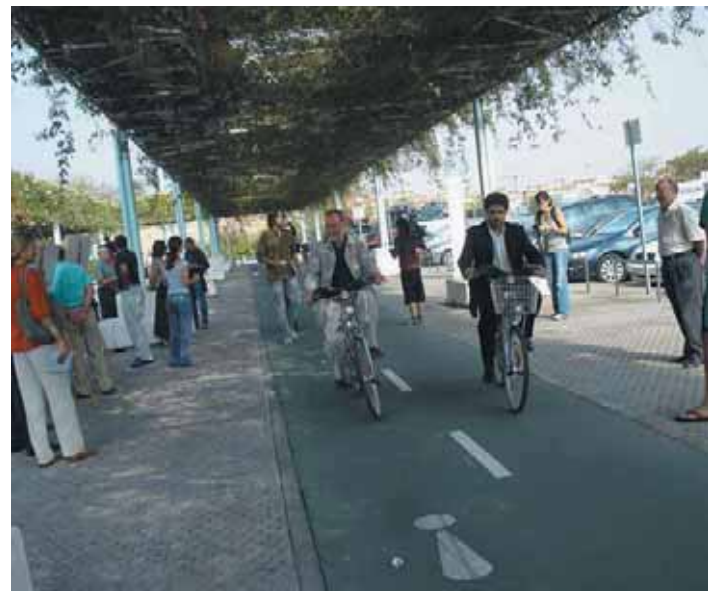
Carril-bici, en Sevilla.

El jurado responsable de evaluar las propuestas presentadas y determinar cuáles eran merecedoras de los premios ha estado compuesto por la FEMP, los Ayuntamientos de Barcelona, Madrid y Vitoria (este último en su calidad de ganador en la categoría de Ciudad Sostenible en la pasada edición), la Generalitat de Cataluña, el Instituto Catalán de la Energía, la Junta de Andalucía, el anterior Ministerio de Medio Ambiente y la Fundación Forum Ambiental ★