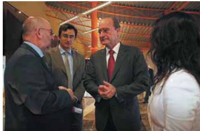
El Alcalde de Málaga, junto con los organizadores, en el transcurso de las jornadas.